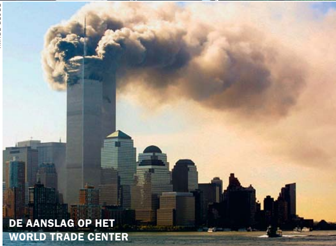
DE AANSLAG OP HET WORLD TRADE CENTER

‘Soms is de waarheid zo simpel dat mensen moeite hebben om ze te aanvaarden.’