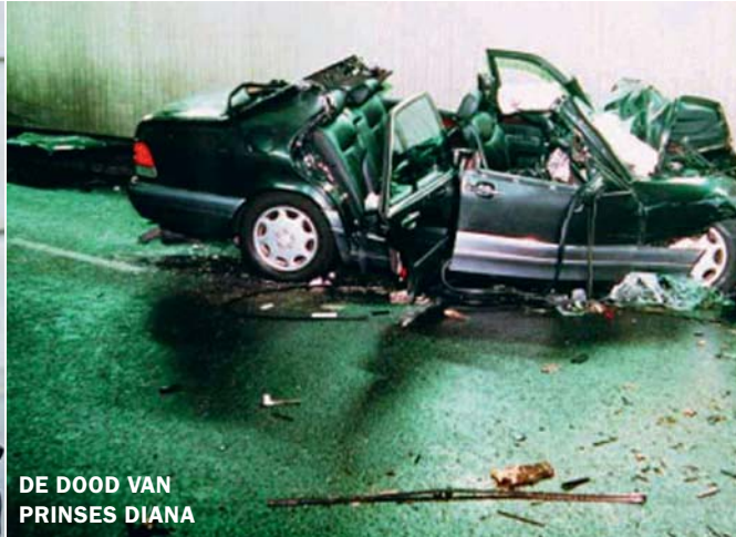
DE DOOD VAN PRINSES DIANA

‘Soms is de waarheid zo simpel dat mensen moeite hebben om ze te aanvaarden.’